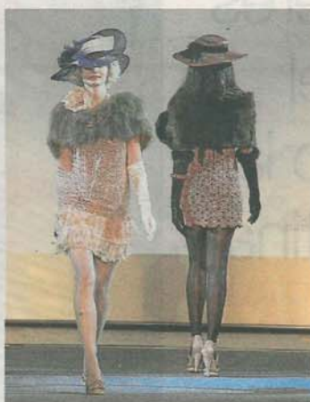
NENELL'AS. Vestido mini juvenil con encaje, gasas y brillantes en rosa nude.