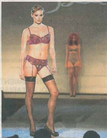
BELL. Conjunto de ropa interior violeta con complemento de medias de blonda.