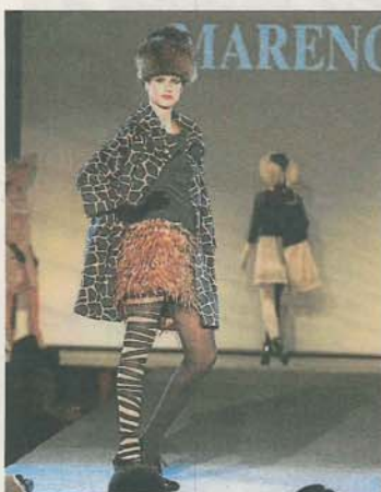
MARENGO. Abrigo con estampado 'animal print' y vestido con plumas.

Para los hombres regresan las líneas clásicas con toques de elegancia como las americanas de