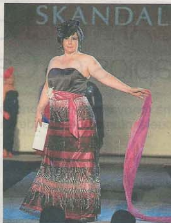
SKÁNDALO DELUXE. Vestido largo de ceremonia en negro, blanco y fucsia.