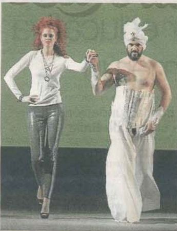
JOYERÍA LAPERLA. Maxi collar de oro blanco con ébano y pulsera a conjunto.