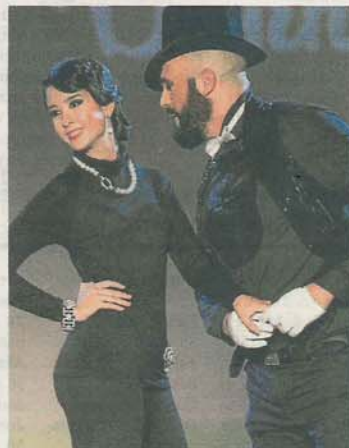
JOYERÍA DEKHAN. Collar de perlas con cierre de brillantes y pulsera a juego.