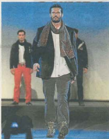
BALLARÍN. Conjunto sport de camisa blanca y americana con pantalón oscuro.