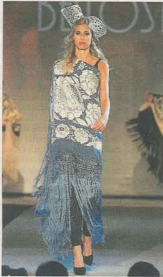
BELLOSTAS. Mantón bordado en tono azul y blanco de la firma de bisutería.