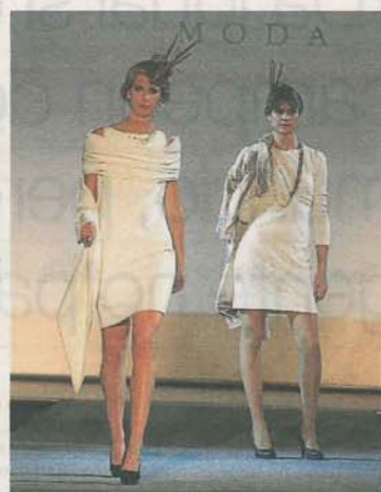
CANTONADA. Líneas clásicas y tonos crudos en vestido de cóctel y ceremonia.