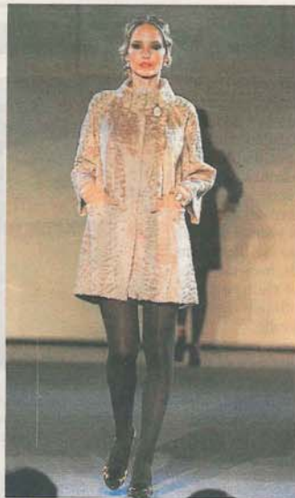
PELETERÍA GABRIEL. Diseño de Belén Morales en crudo.