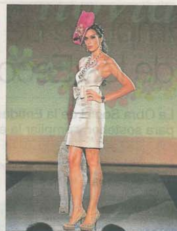
NOVIA BY ISABELLA. Vestido de cóctel palabra de honor en gris metalizado.