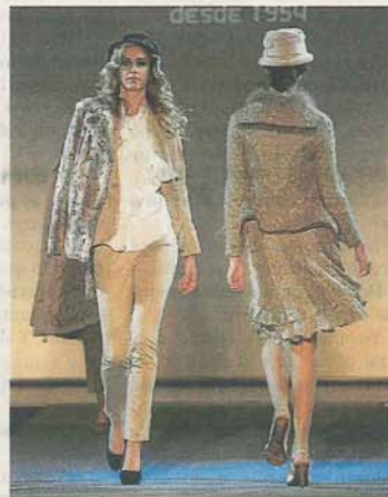
BOUTIQUE ESCOLA. Conjuntos de punto de falda y pantalón en colores tostados.