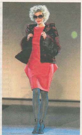
PELETERÍA MORALES. Abrigo corto de diseño juvenil de color rojo.