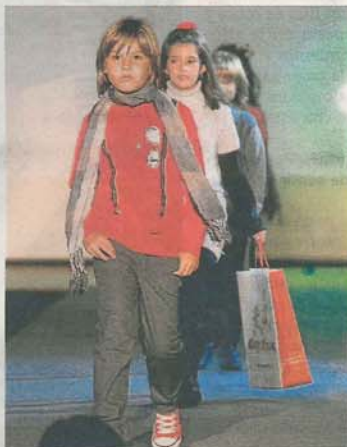
CHIQUITINES. Looks urbanos con colores llamativos para la vuelta al cole.