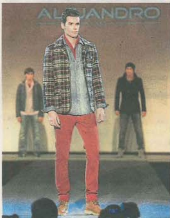
ALEJANDRO MODA. Pantalón rojo con americana a juego y camisa vaquera.