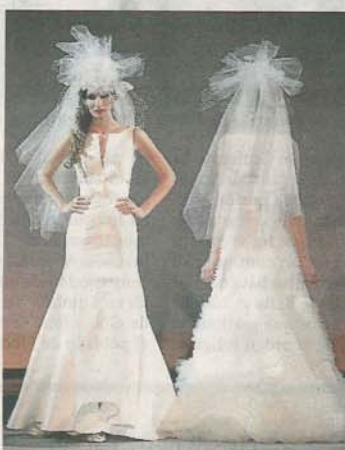
MUNDONOVIAS. Líneas clásicas y sencillez en las propuestas nupciales.