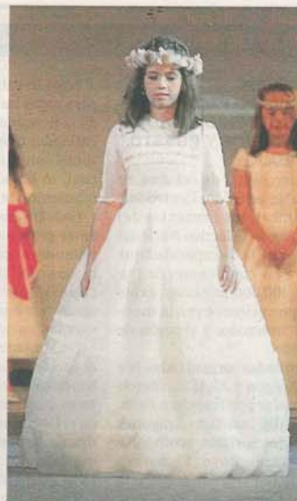
BOUTIQUE ROYO. Líneas clásicas e infantiles en trajes de comunión.